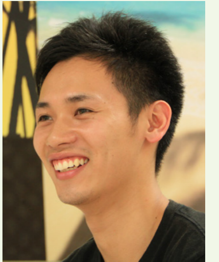
経営学部 9 期生

9 月より清光会館 1 階にありました同窓会事務局は、昨年新しくできました水田三喜男記念館に移転いたしました。是非記念館をご覧ください、事務局にもお立ち寄りください。