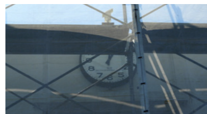
▲自動車部OBからご寄付いただいた大きな時計