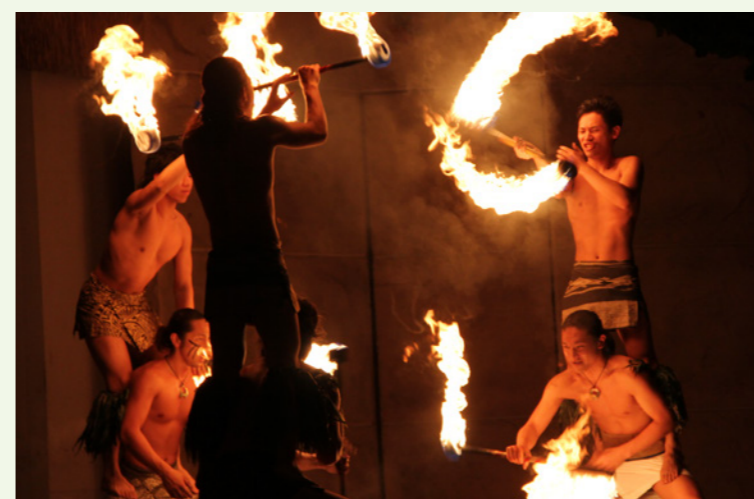
スパリゾートハワイアンズ https://www.hawaiians.co.jp

目標は世界チャンピオンです。それには世界大会に出場しなくては行けませんので、先輩や後輩の中で一番にならなければいけません。それと、もっとファイヤーナイフダンスを盛り上げていきたいです。是非、スパリゾートハワイアンズに来てショーを見てください。