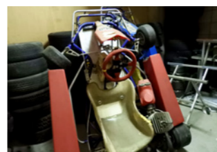
▲しっかりしています

こちらは、学内の某倉庫。どうやら自動車部(?)が活動していた時のものが残されたまま「らしい」のですが、そこにあったのが、このカート。なんと、3台もありました。どういうモノなのか、どう使ったのか、なぜここにあるのか、もっと言えば自動車部が関係しているのかいないのか、今となっては謎です。埃をかぶっていますが、整備すれば動きそうです。でも、かたづけないと倉庫が使え……。