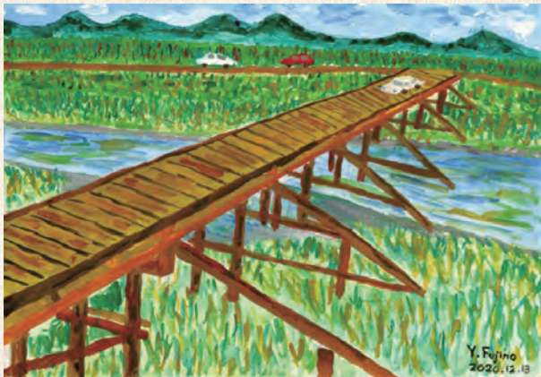
藤野学長が描かれた水彩画「高麗川に架かる多和田天神橋」