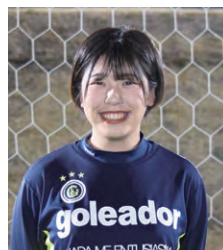
澤キャプテンインタビュー（経営学部3年）

大学内外に【城西大学体育会サッカー部女子部門】の活動を知って頂くことを目標にしております。来年度から、関東大学女子リーグに加盟出来れば、多くの方々にも存在を知って頂けることと思います。文武両道を実践し、競技力向上だけでなく、充実したキャンパスライフを過ごしながら、学生の将来を豊かに出来るような活動をアピールしていくことが目標です。